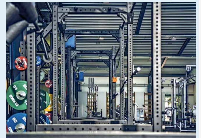
Ein kleiner Einblick in den grossen Trainingsraum